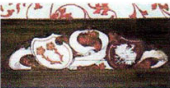
Wappen Stadt Rapperswil und Polen: die seit 1870 bestehenden Beziehungen sollen neu gestärkt werden. Flachschnitzerei im Grafenzimmer des Schlosses, 1893 von Stefan Herweg.

Das im kommenden Jahr 140jährige Polenmuseum mit seinen rund 10'000 Besuchern aus aller Welt pro Jahr wird als wichtiger Teil in der Biografie des Schlosses, aber auch als touristisches Faktum und Potential gewürdigt. Eine Neuorientierung konzeptionell und gestalterisch wird aber unumgänglich sein. Das Thema „Migration“ soll auch polenunabhängig im so genannten Gügelerturm eine regional- wie internationalbezogene Erweiterung erfahren. Das in den 1950er Jahren zugemauerte, aber gut erhaltene Mausoleum für den wichtigsten polnischen Freiheitshelden, General Thadeusz Kosciuszko, soll wieder geöffnet werden. Die Studie wird Ende Jahr abgeschlossen sein. Nächste Schritte könnten in ein Konkurrenzverfahren überleiten.