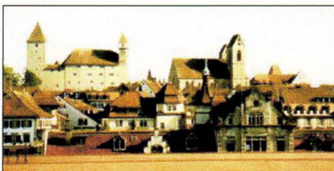
Schloss Rapperswil: Identitätsstarkes Signal über der Stadt, als Kulturplatz aber doch für breite Kreise fremd geblieben. Foto: Peter Rölli 2002

Schloss und Stadt Rapperswil sind um 1220 entstanden. Die einst starke Herrschaft der Rapperswiler Grafen in der Innerschweiz war mit dem Tod der letzten Gräfin Elisabeth 1309 bereits am Ende.